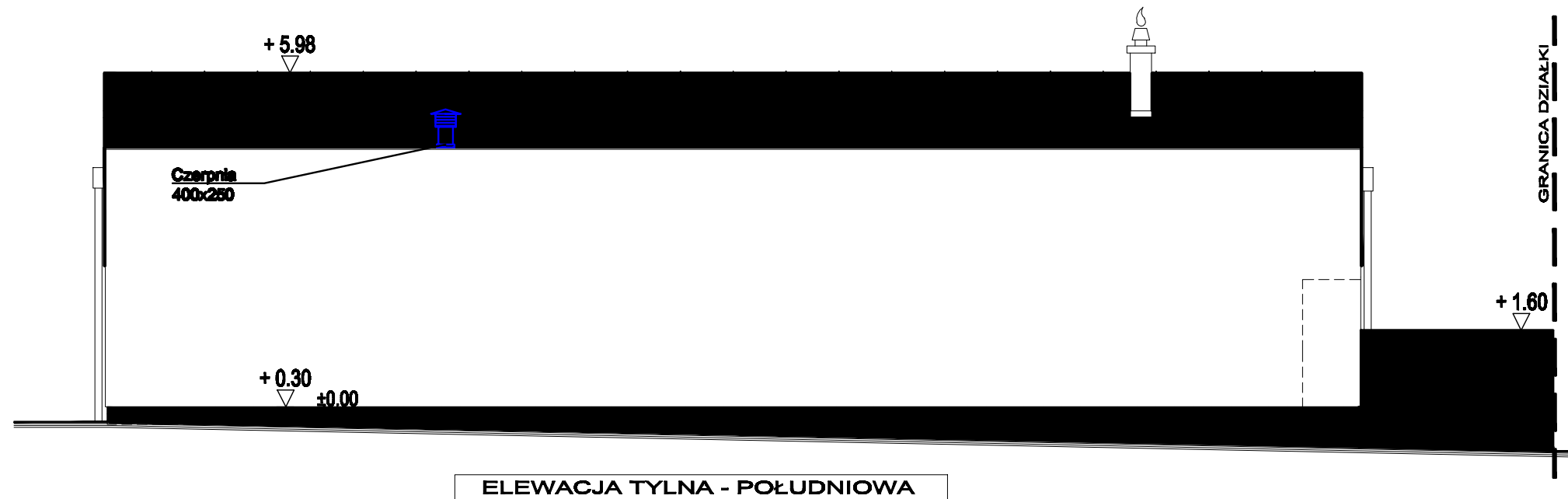
ELEWACJA TYLNA - POŁUDNIOWA