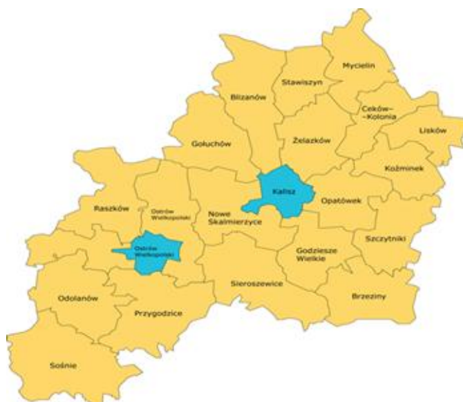
Rys. 1. Gminy wchodzące w skład miejskiego obszaru funkcjonalnego ośrodka regionalnego Kalisza z Ostrowem Wielkopolskim, Źródło: opracowanie własne